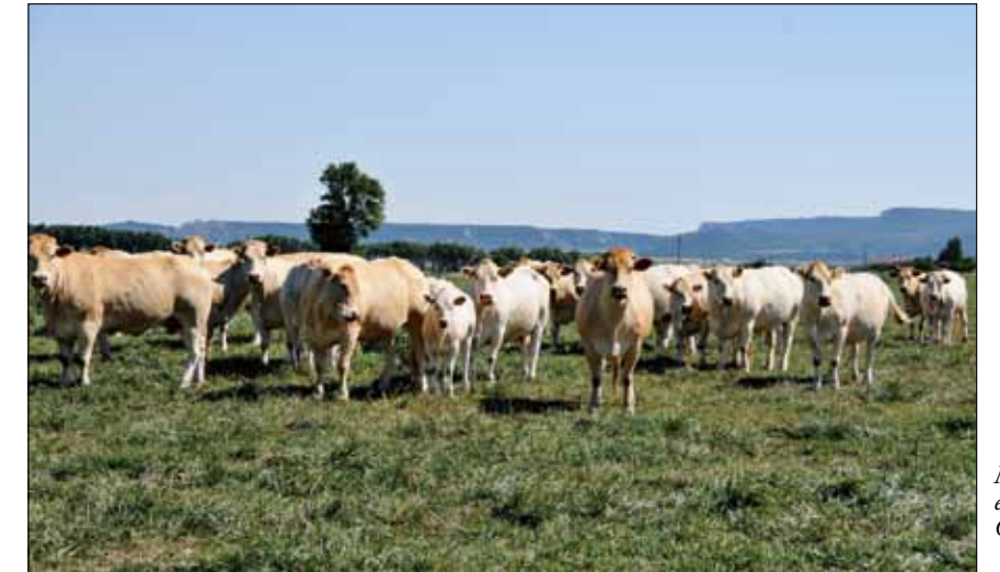
Manada de vacas en Ejea de los Caballeros

También es destacable la importancia de la comunidad en el engorde de terneros debido a la riqueza de la región en materias primas (cereales y forrajes) hacen de la misma un punto estratégico para el engorde de vacuno. Si bien los cebaderos no están inscritos en la Asociación es de justicia que se mencione la importancia que la raza Blanca de Aquitania tiene para estos, pues son muchos los ganaderos que han optado por cebar única y exclusivamente con terneros de la raza y sus cruces. Así, se estima que el número de cabezas de raza Blanca de Aquitania que actualmente se engordan en la Comunidad de Aragón oscila entre 2.800