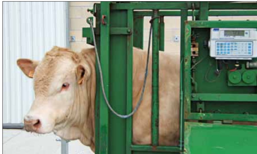
V-Caribe pesó 723 kg al año de edad

Teniendo en cuenta los distintos tipos de manejo y las distancias kilométricas existentes, CONABA ha habilitado dos centros de Testaje, uno ubicado en la Granja Ibarrola de Aia (Gipuzkoa) propiedad de la Diputación Foral de Gipuzkoa que da servicio a la Cornisa Cantábrica y a un