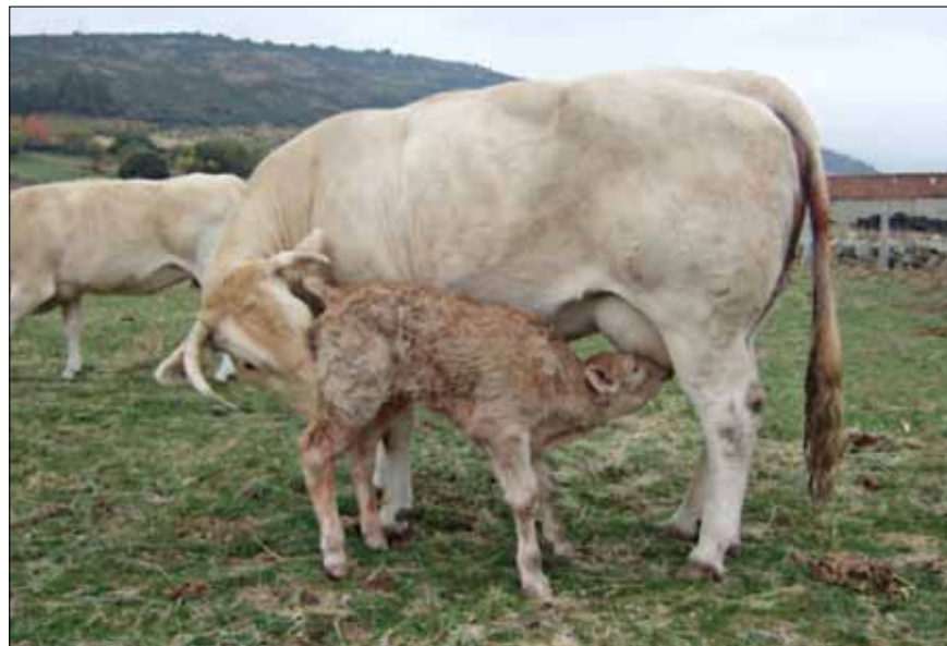
Gran facilidad de parto y vitalidad de los terneros al poco tiempo de nacer

La raza Blonde ya estaba presente en Castilla y León hacia varios años, pero es en 2010 cuando se decide crear ABACYL (Asociación Blonde Aquitaine Castilla y León).