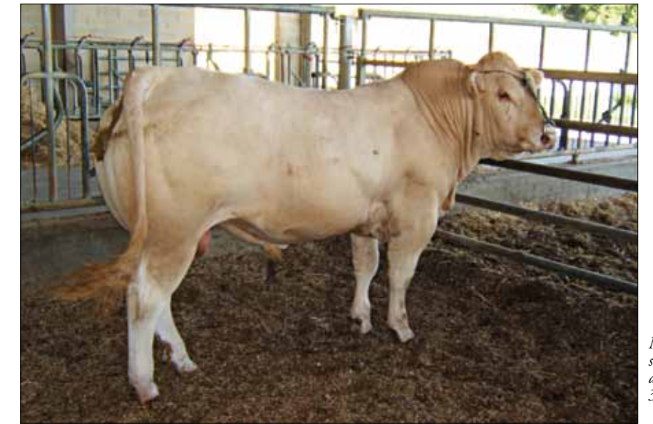
Novillo ELIAS subastado el año pasado por 3.400 €

y al toro VELOURS, hijo de RAVISSANT, ha participado en el Concurso SIA de Paris 2011. Estos toros, propiedad de los ganaderos de Cantabria,