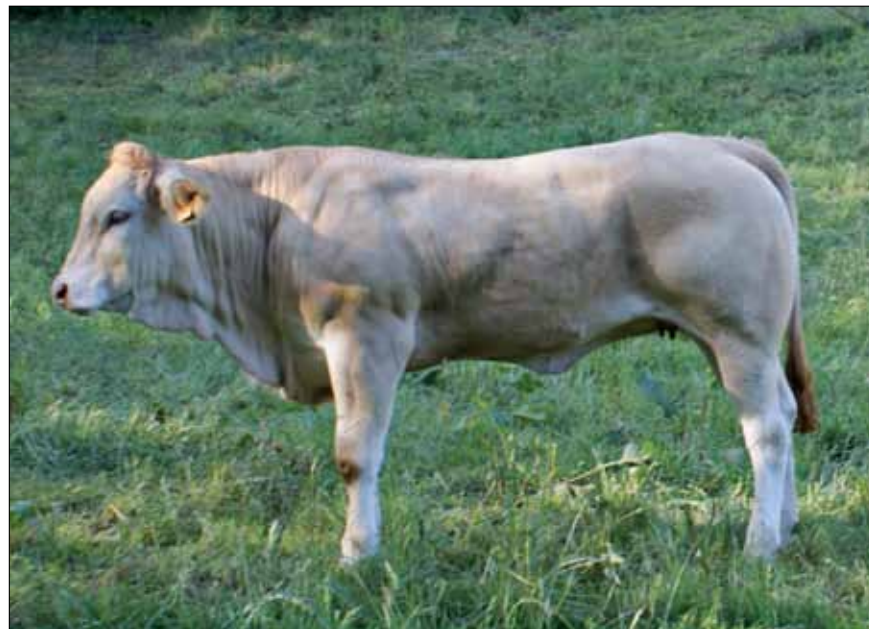
Una raza perfectamente implantada