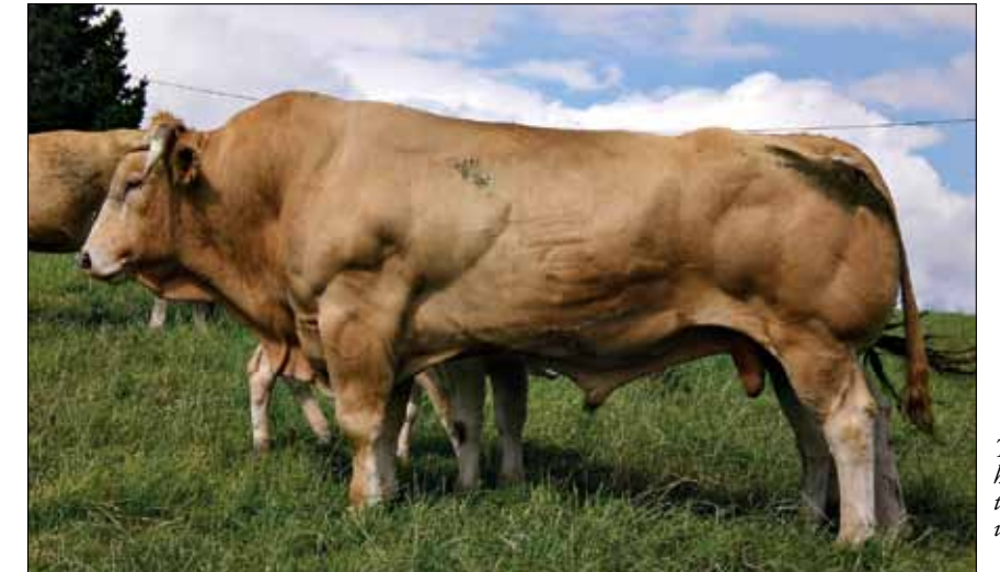
Toro UCCELO, hijo del mítico toro RUBIO, un valor seguro

Los resultados obtenidos por los ganaderos que han optado por un semental blonde de aquitania para sus ganaderías con madres gallegas, asturianas y los diversos cruces entre estas y otras razas tan extendidos en nuestra comunidad, han hecho que cada vez más ganaderos opten por introducir sementales de la raza, ya que con ello consiguen eliminar o reducir a la mínima expresión los problemas en los partos, consiguiendo una importante mejoría en los pesos, rendimientos, conformaciones de canal y sobre todo, y lo que es más importante y apreciado, una gran regularidad en la descendencia. Parafraseando a un ganadero en una visita a una explotación de un socio de ABAGA que usa sementales tanto en pureza como en diversos cruces "esto no es un toro, es una fotocopiadora".