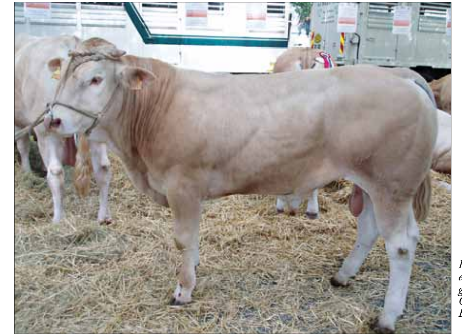
ESKIMO novillo en testaje entre ganaderos de ORDAGO y EBAFE

Antes de nada, queremos resaltar el alto grado de implicación del ganadero de EBAFE en el Plan de Mejora, así el 41% de los ganaderos participa en el Programa de Control de Rendimiento Cárnico, lo que supone recoger datos de producción del 52% de las vacas de la federación. Los técnicos pesadores visitan trimestralmente las explotaciones y pesan los animales menores de año, entregando al ganadero los informes de ganancias propias y comparadas con la media de la asociación. Todos estos datos de granja junto con los datos de matadero (peso sacrificio, conformación y engrasamiento) se envían anualmente, junto a los datos de las demás asociaciones de CONABA, a la Facultad de Veterinaria de la Universidad de Zaragoza, donde la Cátedra de Genética Aplicada realiza la evaluación genética de los genitores de la Raza en España.