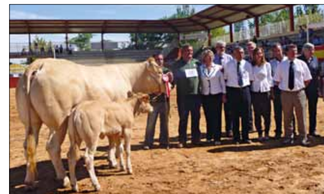
Delegación de FIERBA y cargos politicos de la Diputación Salamanca