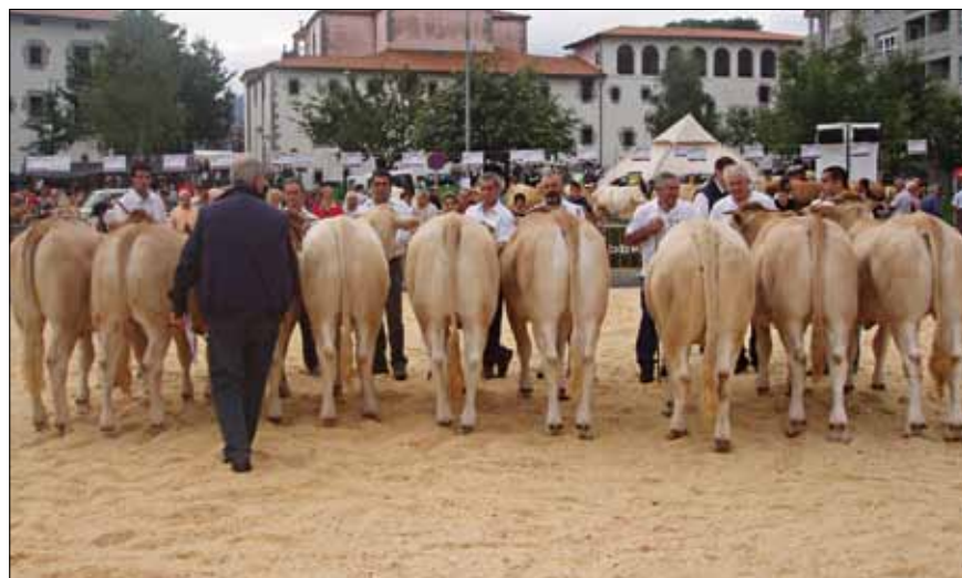
Excelente lote de novillas participantes en la feria de Markina 2009