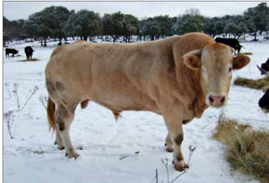
Semental Blonde en ganadería de Avileñas.

Asociación Blonde Aquitaine Castilla y León