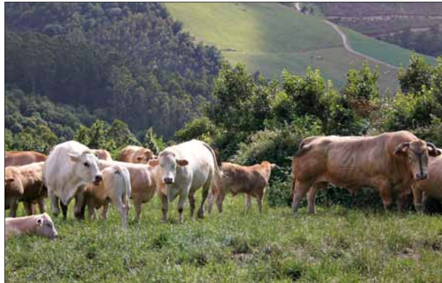
Perfecta adaptación al medio