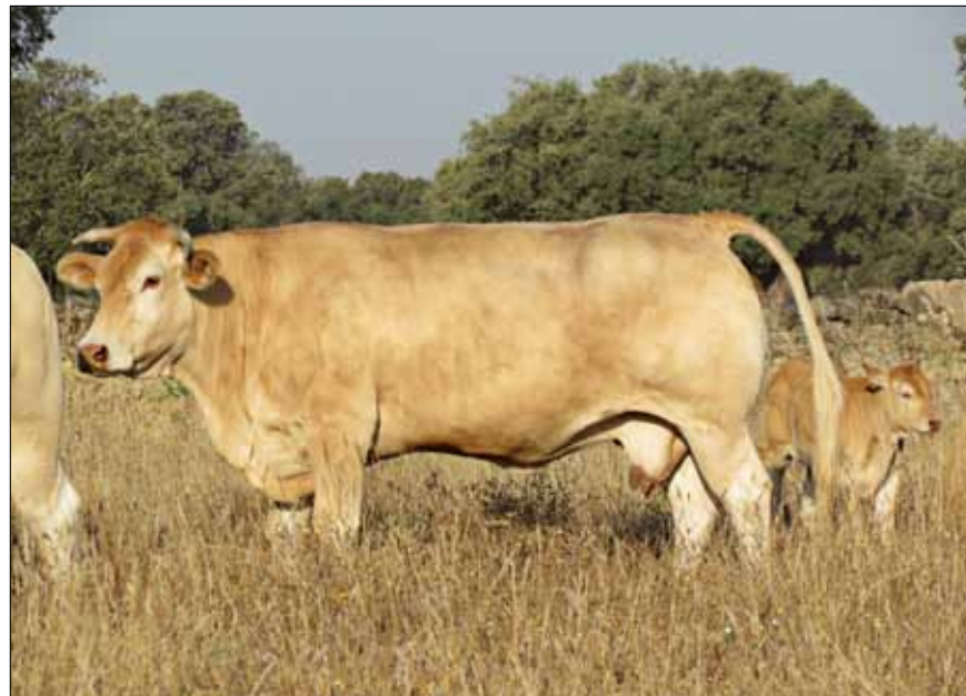
Soportan sin problemas los rigores climatológicos