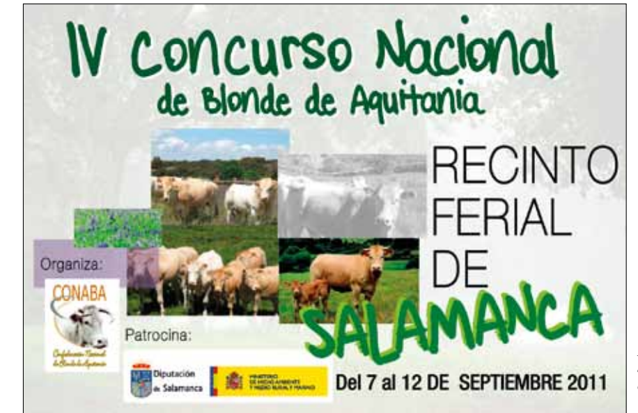
Cartel de la Feria de Salamanca de este año

- Animales de Exposición: Se contara con la presencia de 2 sementales de origen francés. Animales de gran formato, con muy buen carácter racial y servirán como escaparate del gran potencial de crecimiento que posee esta raza. El asistente a la feria podrá ver al toro AARON, dos veces Campeón de Francia en las ediciones de la feria SIA de Paris los años 2009 y 2010