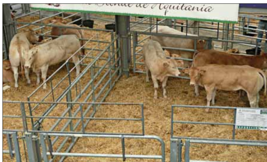
Animales presentados el pasado año en Colmenar