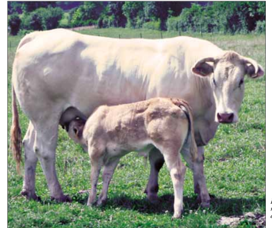
Las cualidades maternas son excelentes

A día de hoy, ABACAN está compuesta por 45 socios, distribuidos por las distintas zonas de la región. Los hay en zona de costa, donde el terreno es llano y muy productivo y en zonas intermedias de la región, pero llama mucho la atención que hay ganaderos en zonas altas de montaña, Valle de Soba y Liébana, donde la raza blonde también se adapta y produce muy buenos rendimientos.