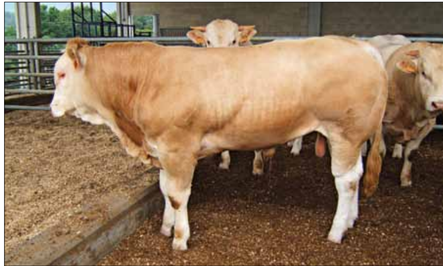
Los novillos proceden de explotaciones en Control de Rendimientos