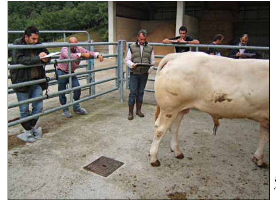
Los novillos a examen

Se celebró en la localidad de Azkoitia, el pasado 17 de agosto. Contó con la participación de 51 animales procedentes de 5 explotaciones de Gipuzkoa que compitieron en las 10 secciones disputadas, además de los premios especiales al Mejor Macho, Mejor Hembra, Mejor producto de I.A. y Mejor Ganadería.