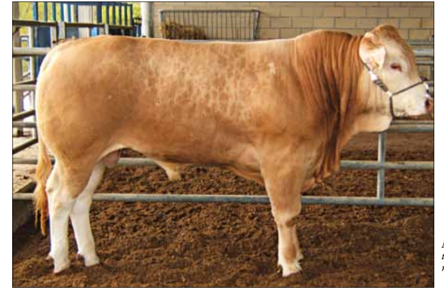
Novillos de testaje, base de la mejora genética

Destacar que en junio se acaba de crear la página web del Centro de Testaje ( www.testajeaia.com ) en la que además de recoger información referente a ubicación, sistema de trabajo, horarios etc, el ganadero podrá consultar las fichas individuales de los novillos en testaje (tanto de entrada como de salida) así como las fichas de evolución de pesos individuales y del lote de testaje. En las fichas individuales, además de la información genealógica, morfológica y reproductiva de sus progenitores se recogen datos propios del novillo, valores de calificación a la entrada y salida de la Estación así como consejos de uso (aptitud vida, mixta o cárnica). En dicha página también se recogen noticias referentes a