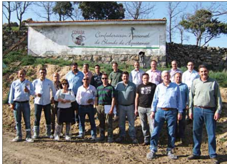
Participantes venidos de 4 autonomías participaron en el Curso