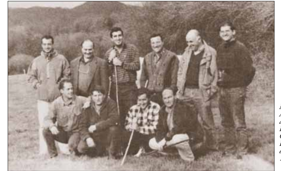
Miembros de ABANA junto a Técnicos de I.T.G.V. y de Cooperativa de Bayona. Diario de Navarra de 1995

Con la creación y expansión de CONABA se establecen contactos con otros ganaderos del Estado amantes de la Blonda. Así durante estos últimos años han sido varias las ventas de genética (fundamentalmente terneras) a varios lugares. Un hito a destacar es el reconocimiento en 2003 de la Blonde como raza "española" y que nos ha permitido acceder a concursos, subvenciones y ayudas.