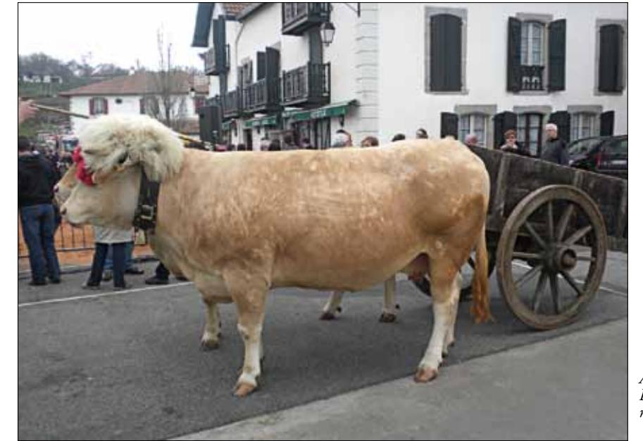
Antiguamente la Blonde era una raza de trabajo

Esta manera de funcionar de los ganaderos del "otro lado" fue impregnando en los de ABANA y les decidió a establecer el Libro Genealógico Inicial en el año 1997 y a utilizar las pesadas en granja a partir de 1997. Actualmente 15 explotaciones pesan trimestralmente los terneros, siendo la Asociación con mayor