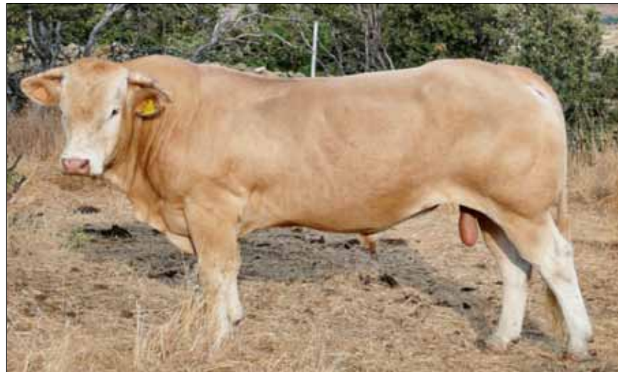
Animales muy longilíneos