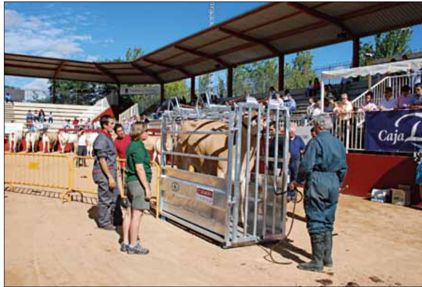
Pesado de animales feria Salamanca 2010

La Confederación CONABA participara en la 23 Exposición Internacional de Ganado Puro que se celebrara del 7 al 12 de septiembre en el Recinto Ferial de Salamanca.