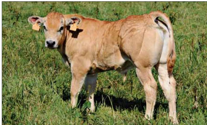
Ternero Gasconne X Blanca de Aquitania

La presencia de la raza Blanca de Aquitania en Aragón históricamente se circunscribe al área pirenaica dada la proximidad a la región francesa que da origen a la raza y las relaciones comerciales que siempre han existido con la misma. Así pues, hace décadas que se encuentran ejemplares que