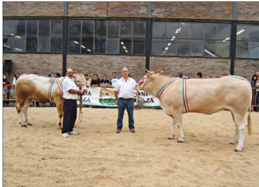
ECLAT y DIANA Grandes Campeones de Euskadi 2010