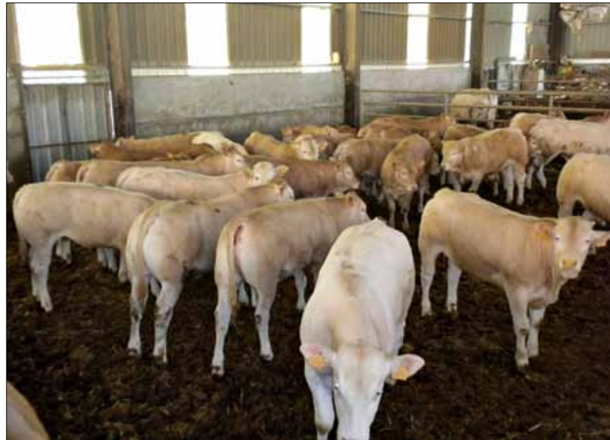
Lote de terneros al destete

A.B.A.NA la Asociación Blonde de Navarra es una de las fundadoras de CONABA (1997). Nace en diciembre de 1995 contando en sus inicios con 37 explotaciones y 1700 vacas, en su mayoría cruce absorbente con Blonde durante años a partir de las vacas con que ya se contaba en las ganaderías. Esta es una característica a resaltar, la mejora en las explotaciones se ha hecho vía padre, comprando sementales de calidad, y las importaciones de hembras no han sido reseñables. Actualmente ABANA cuenta con 53 ganaderos asociados, 2.200 vacas madres y 54 toros sementales, siendo la Asociación que cuenta con mayor número de vacas y la que más animales tiene en Registro Definitivo (carta completa).