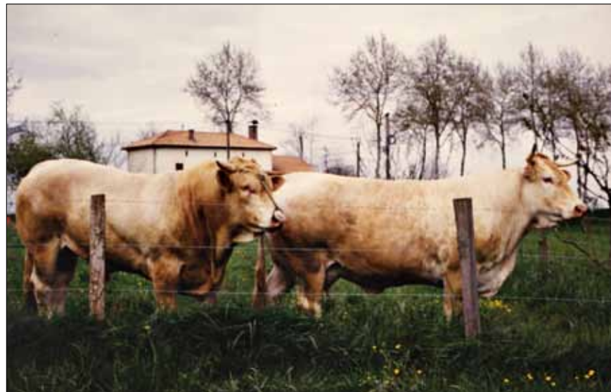
Ejemplares de M.Planté en la primera visita para compra de sementales (RIQUITA y BOLINO)

y el abandono del ganado en beneficio de la patata de siembra, se desarrolla una práctica que consistía en sustituir los terneros muertos al parto por terneros Blonde comprados en el Mercado de Donibane-Garazi (St. Jean Pied de Port), y, a partir de ver su mejor crecimiento y conformación algunos ganaderos completan los lotes de terneros en cebo con pasteros Blonde para mejorar el lote y conseguir más precio. (En aquellos años el precio del kg canal era parecido al de ahora, y han pasado 40 años). En los años 80 una serie de ganaderos jóvenes y dinámicos ante la inexistencia de toros testados en la raza pirenaica y la constatación de problemas al parto se deciden a introducir sementales Blonde en sus rebaños de vacas, y los buenos resultados obtenidos les hacen perseverar en la idea. Así en 1988 se producen las primeras compras con carta genealógica que tenemos conocimiento. Se visitaron varias explotaciones cercanas y se compraron terneros hijos de Simon (I.A.) y Maestro (I.A.). En los años posteriores siguió la dinámica de compra de terneros de 7-8 meses con datos y carta y con el asesoramiento de Michel Idiart de Lurberri. Hasta 1995 se adquirieron 52 animales, 41 de ellos hijos de I.A.