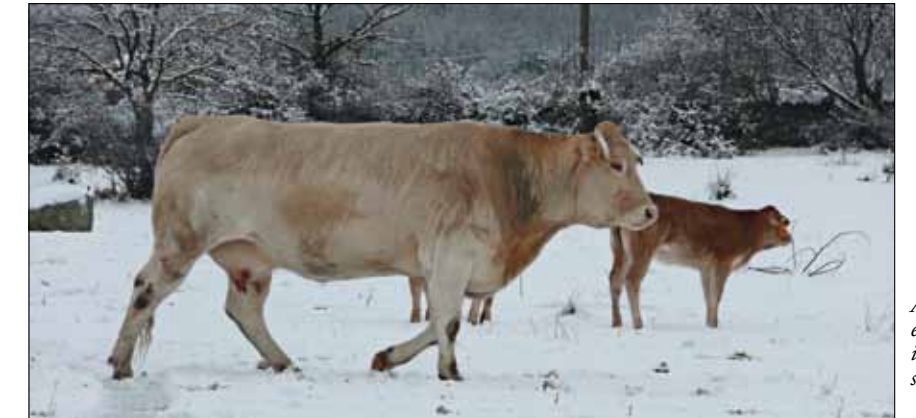
Animales blonda en el duro invierno de la sierra madrileña