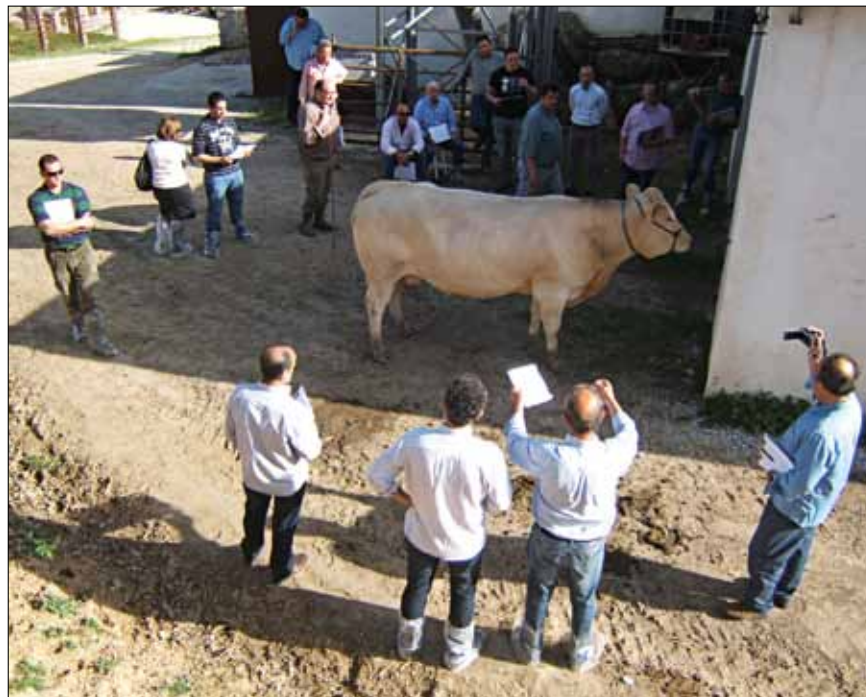
Puesta en común de las calificaciones emitidas por los alumnos

Durante el 2011 la Confederación CONABA ha organizado los siguientes eventos: