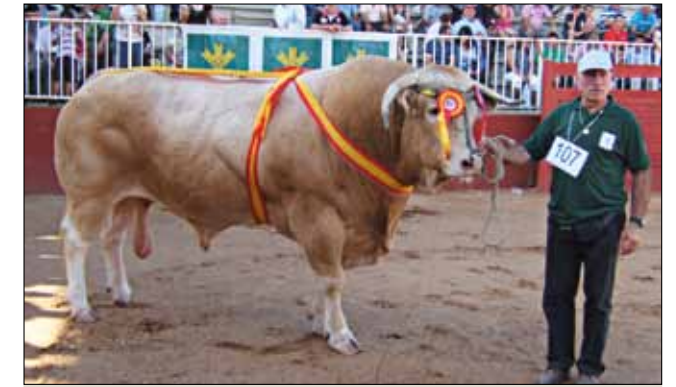
Toro VEN Campeón sección X Toros mayores de 24 meses y Gran Campeón del Concurso. Antonio Olaizola - Azpeitia (Gipuzkoa)