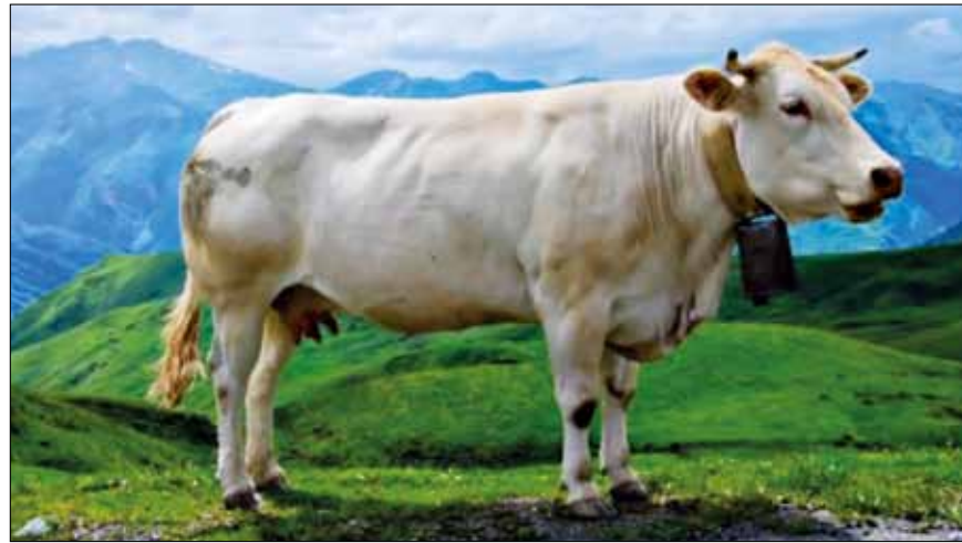
Vaca Blanca en Pirineo Aragonés