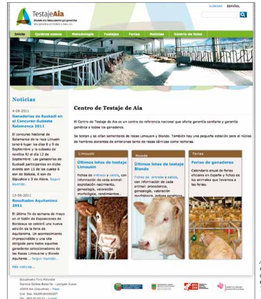
Aspecto de la nueva página web del Centro de Testaje AIA

eventos ganaderos, calendarios de celebración, palmares de ganaderos, etc así como fotos de las distintas ferias en las que participan nuestros animales. Desde estas líneas, queremos