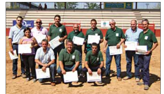
Reparto de titulos de Jueces Ganaderos