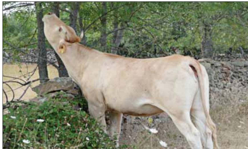
Aprovechamiento total del entorno