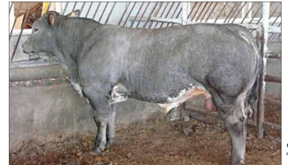
Cruce de blonda con vaca mestiza