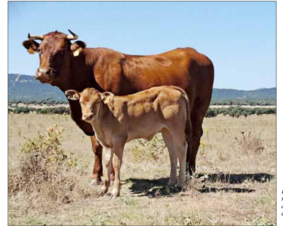
Excelentes resultados al cruce con otras razas

hace de la Blonde de Aquitania una raza ideal para el cruce industrial en extensivo, tanto con otras razas cárnicas, como Charolés y Limousine, como con razas autóctonas, como la Retinta, la Berrenda o la Negra Avileña, e incluso con razas mixtas. Los terneros que se consiguen en estos cruces alcanzan fácilmente los 200 kilos entre los 4 y 5 meses en campo, sin ser suplementados, y los 300 a los 7 meses si son suplementados con pienso. Además, el rendimiento de los terneros al cebo, machos y hembras, es extraordinario, y muy valorado por los cebadores, obteniéndose ganancias medias diarias en el entorno de 1,5 a 2 Kg.